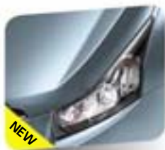
Arctic Blue (metallic)