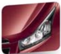
Velvet Red (metallic)