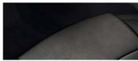
LTZ - Jet Black/Jet Black nijansa enterijera i kožna presvlaka za sedište