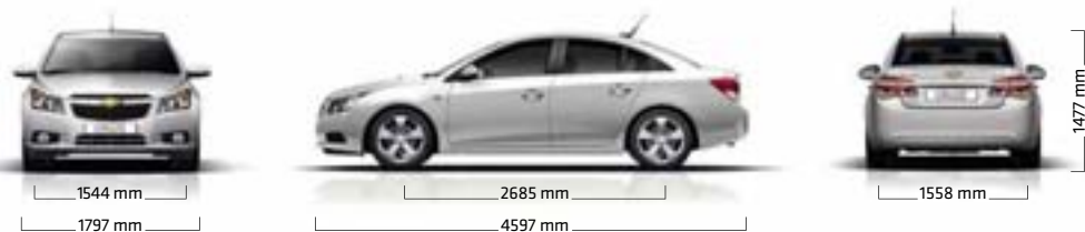
CRUZE 4-VRATA NOĆBEK