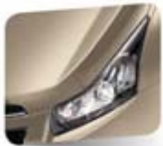
Day Dream Beige (metallic)