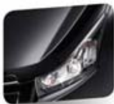
Carbon Flash Black (metallic)