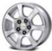
LT: 16" aluminijumske felne (dizel varijanta)