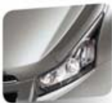
Ice Silver (metallic)