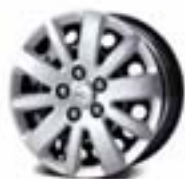
LS i LT: 16" čelične felne sa ratkapnama (benzinska i dizel varijanta)