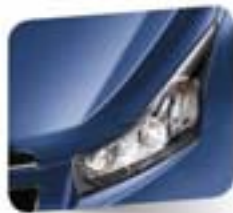
Moroccan Blue (metallic)