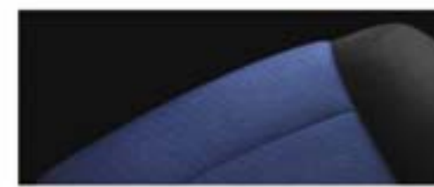
LT - Jet Black/Sonic Blue nijansa enterijera i presvlaka za sedište