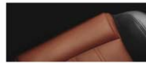
LTZ - Jet Black/Red Brick nijansa enterijera i kožna presvlaka za sedište