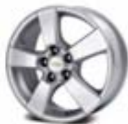
LT: 16" aluminijumske felne (benzinska varijanta)