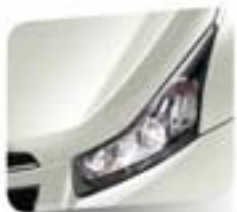
Olympic White (solid)