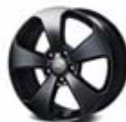
Opciono na modelima LT i LTZ: 17" crno farbane aluminijumske felne (benzinska i dizel varijanta)