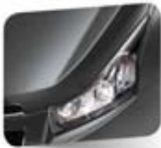
Pewter Grey (metallic)