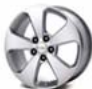
LT i LTZ: 17" aluminijumske felne (benzinska i dizel varijanta)