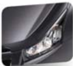
Smokey Grey (metallic)