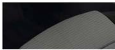
LS - Jet Black/Medium Titanium nijansa enterijera i presvlaka za sedište u glatkom tkanju