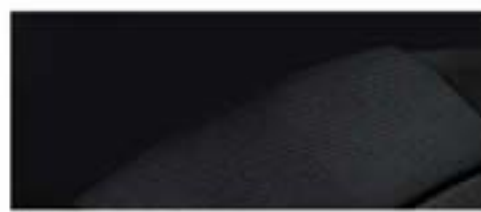
LT/LTZ - Jet Black/Jet Black nijansa enterijera i presvlaka za sedište u mrežastom tkanju